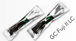
GC Fuji II LC