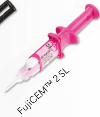
FujiCEM™ 2 SL