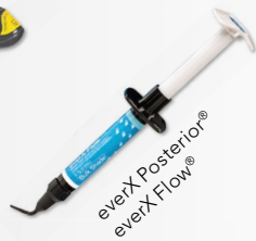
everX Posterior® everX Flow®