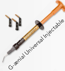
G-aenial Universal Injectable