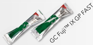
GC Fuji™ IX GP FAST