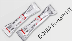
EQUIA Forte™ HT